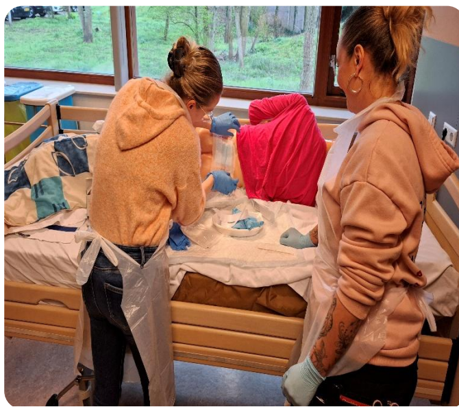
Verpleegtechnische handelingen oefenen op een pop